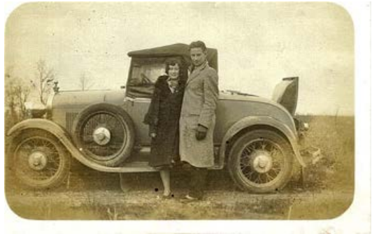
A-Ford 1928

Naast deze gerenommeerde Duitse fabriek waren er natuurlijk ook van andere landen inzendingen zoals uit Amerika. Ford had in 1928 een vestiging in Rotterdam en was in onderhandeling voor een nieuwe locatie,