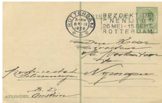
Briefkaart Geuzendam 216 met reclamestempelvlag Nenijto d.d. 8-IX-1928

Museum voor communicatie is momenteel gesloten voor individuele verzoeken om informatie. Wel waren ze bereid mij een scan te sturen van het reclame stempel voor de tentoonstelling. Duidelijk is dat dit een rolstempel betreft, wat machinaal werd aangebracht op de poststukken. Het museum voor communicatie had niets over het ronde stempel