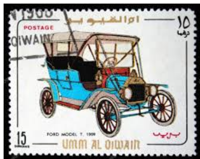
Umm Al Qiwain A-Ford

aan het water gelegen, in Rotterdam. Die onderhandelingen verliepen stroef en waren uiteindelijk reden voor Ford om te verhuizen naar Amsterdam. Op Nenijto waren ze aanwezig met de 1 e A-Ford, als opvolger van de T-Ford