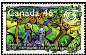
International year of older people, Canada 1999

Ouder worden brengt problemen met zich mee, dat is niet alleen in de Zaanstreek onderwerp van beleidsmakers. De Verenigde Naties besloten in de Algemene Vergadering in haar “Proclamation on Aging” om 1999 uit te roepen tot het Internationale Jaar van de Ouderen. Wat voor veel landen aanleiding was over dit onderwerp 1 of meer postzegels uit te geven.