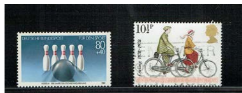
Duitsland 1985 Kegelen Engeland 1978 Cycling