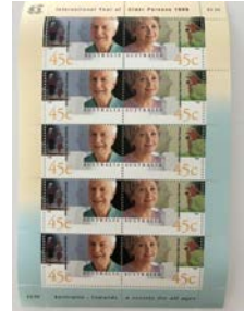
International year of older persons Australia 1999

Zoals gezegd brengt het ouder worden problemen met zich mee. De mobiliteit neemt vaak af, het denken wordt trager en kan van mindere kwaliteit worden, ook het sociaal functioneren kan moeilijker worden. Uiteraard verschilt het per persoon in hoeverre sprake is van achteruitgang op welk gebied dan ook, maar feit is dat ouder wordende mensen langzaam maar zeker behoefte krijgen aan andere leef- en woonomstandigheden.