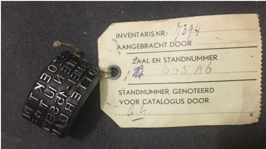
Rolstempel met reclame valg Nenijto 1928

Museum voor communicatie is momenteel gesloten voor individuele verzoeken om informatie. Wel waren ze bereid mij een scan te sturen van het reclame stempel voor de tentoonstelling. Duidelijk is dat dit een rolstempel betreft, wat machinaal werd aangebracht op de poststukken. Het museum voor communicatie had niets over het ronde stempel